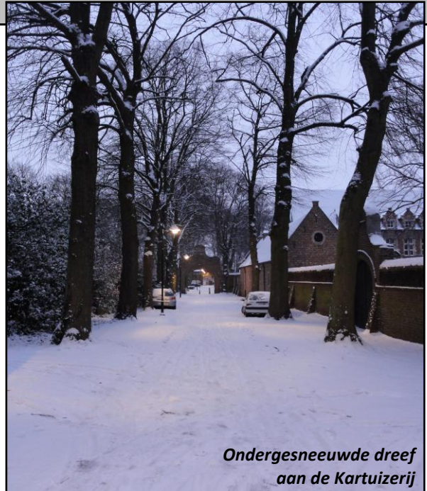
Ondergesneeuwde dreef aan de Kartuizerij