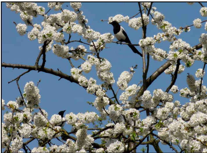
Planten hebben tijdens de winter voldoende koude-uren nodig om goede bloemknoppen te ontwikkelen.