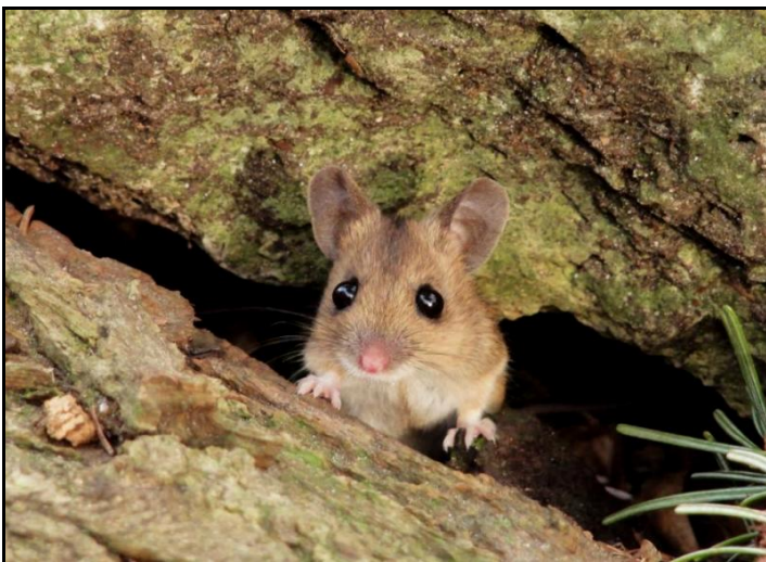
Een Bosmuis op zoek naar voedsel (Kruidtuin)

Met wat geluk hebben we deze Bosmuis kunnen vastleggen op foto. Ondanks haar naam is ze niet strikt gebonden aan bos. Dat deze soort in de Leuvense binnenstad aanwezig was bleek reeds uit eerdere waarnemingen. Maar het fotograferen van deze schuwe en overwegend nachttactieve diertjes is - net zoals bij de meeste zoogdieren - een andere zaak. De nauw met de Huismuis verwante Bosmuis heeft een witte buik en een (geel)bruine rug, met een scherpe overgang tussen beide. Jonge Bosmuizen zijn wel wat grijzer, waardoor verwarring met de Huismuis mogelijk is. Bosmuizen houden geen winterslaap, maar bij voedselschaarste treedt er een soort verstarring van het lichaam op, waardoor veel minder energie wordt gebruikt.