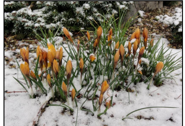
Boven: Meerkoeten op het ijs in de Leuvense Vaartkom. Kokmeeuwen overwinteren in het stedelijk gebied. Onder: Een Krokusvariëteit in de eerste sneeuw.