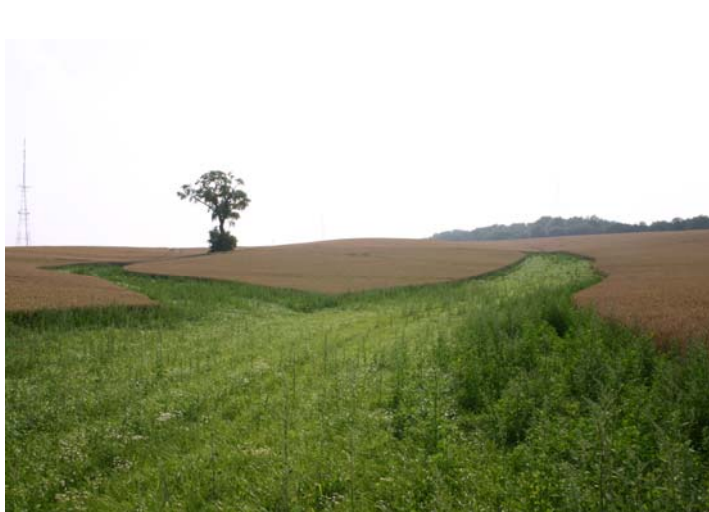
Foto 2: Aanleg van grasgangen vormt een onderdeel van het beheerovereenkomstenpakket 'Erosiebestrijding'. Grasgangen zorgen ervoor dat vruchtbare leemgrond niet afspoelt.

Landbouwers kunnen met de Vlaamse Landmaatschappij beheerovereenkomsten afsluiten. In ruil voor een financiële vergoeding neemt de landbouwer dan maatregelen om bijvoorbeeld erosie te bestrijden of om bosranden, holle wegen en waterlopen te beschermen. Hij leeft daarbij een reeks voorwaarden na. De bedrijfsplanner van Regionaal Landschap Dijleland vzw heeft als taak om deze overeenkomsten aan te moedigen. En dat levert resultaat op! De voorbije twee jaar werden zo 51 km perceelsranden langs bos, houtkanten, holle wegen en waterlopen en 60 ha grasbufferstroken en grasgangen aangelegd. Zo zal het Mollendaalbos in Bierbeek vanaf deze winter gebufferd worden door grasstroken met een totale lengte van 2360 m. Deze grasstroken zullen er voor zorgen dat de