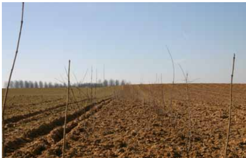
Foto: Pas aangeplante houtkant aan de Ganzemansstraat in Neerijse.

Naast inventarisatie en sensibilisatie, behoort het promoten en ondersteunen van landschapsherstelmaatregelen tot de belangrijkste aspecten binnen de uitvoering van het beschermingsplan voor de das. Op 12 oktober 2005 organiseerde Regionaal Landschap Dijleland vzw een info-avond voor WBE's omtrent beheerovereenkomsten voor landbouwers. Tijdens deze avond