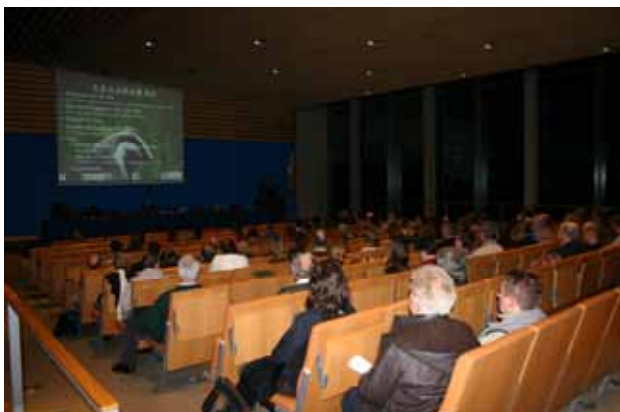
Foto: De informatie-avond over de das in het Leuvense provinciehuis kende een grote opkomst.

Op 8 december 2005 organiseerde Regionaal Landschap Dijleland vzw een informatie-avond voor het grote publiek over de uitvoering van het beschermingsplan voor de das. De opkomst was een groot succes (110 personen)! Eddy Dupae en Ludo Fastré gaven uitleg over de biologie van de das resp.