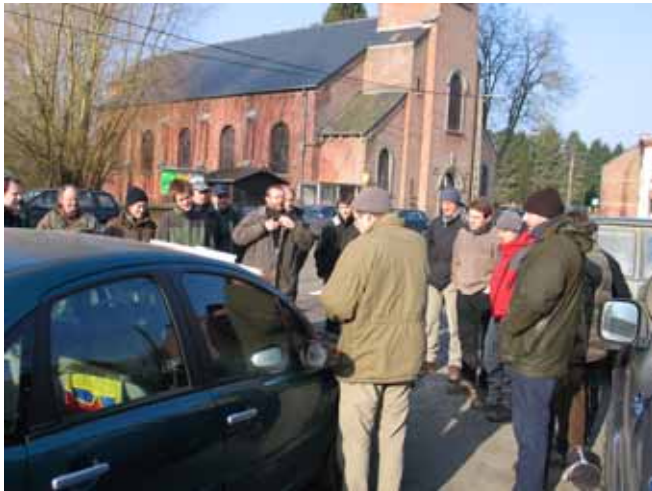
Foto: Op een frisse zaterdagmorgen werd aan de kerk van Tangissart afgesproken om daarna in kleine groepjes bosgebieden te bezoeken.

Op 18 maart 2006 organiseerde Regionaal Landschap Dijleland vzw in samenwerking met de LIKONA Dassenwerkgroep, de Groupe de Travail Blaireaux (Natagora/AVES) en de Zoogdieren-inventarisatiewerkgroep (ULg) een zoektocht naar dassensporen en bezette dassenburchten in de regio Villers-la-Ville.