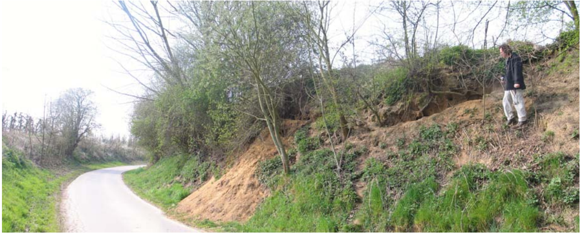
Foto: Tijdens de zoektocht werden verschillende nieuwe bewoonde burchten gevonden waaronder hier in een holle weg in Wellen.

gemeenten Borgloon, Wellen en Heers. Aan de hand van deze inventarisaties kan ingeschat worden in hoeverre de populatie aan het uitbreiden is richting Vlaams-Brabant en het Dijleland. Het resultaat van de zoektocht was mooi: er werden minstens 3 nieuwe hoofd- en 6 bijburchten gevonden. Op verschillende plaatsen werden prenten en haren teruggevonden wat eveneens op aanwezigheid van dassen duidt. Door middel van verder inventarisatiewerk moeten enkele twijfelgevallen nog uitgeklaard worden. Eveneens zullen nog andere stukken binnen het zoekgebied nog bezocht worden.