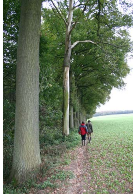
Foto 1: De randen van Vlaamse bossen worden vaak gekenmerkt door scherpe overgangen met de omgeving. Hier een zicht op de zuidrand van het Meerdaalwoud in Bierbeek.

Om particuliere bouseigenaars te ondersteunen in het (ecologisch) beheer van hun bos zijn er 'bosgroepen' in het leven geroepen. Een bosgroep is een vrijwillig samenwerkingsverband voor alle bouseigenaars van een werkingsgebied. Voor het Dijleland (uitgezonderd Kampenhout) is er de Bosgroep Dijle-Geteland. In het kader van het dassenproject werd contact opgenomen met graaf de Liedekerke. Hij werd bereid gevonden om - in samenwerking met de Bosgroep Dijle-Geteland - een zevental hectare populierenbos om te vormen. Ken je mensen die grote of kleine bossen in eigendom hebben? Bezorg hen dan zeker de contactgegevens van de coördinator van de bosgroep (Jeroen Franssens, 016/298548, bosgroep@igo-leuven.be )!