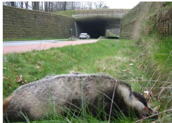
Foto: Dode das aan het ecoduct "De Warande" langs de Naamsesteenweg in het Meerdaalwoud in Bierbeek.

Er werden in 2007 reeds verschillende dassenkadavers langs onze wegen gevonden. Alle dieren werden ingezameld in het kader van het marternetwerk van het Instituut voor Natuur- en Bosonderzoek. In Essenbeek (Halle) werd op 27 februari een dode das gevonden langs de gewestweg N203a. Het ging hier om een eerstejaars wijfje. Deze das haalde de pers op 2 maart in het Nieuwsblad. Op de Naamsesteenweg in Bierbeek werd t.h.v. ecoduct 'De Warande' een das aangetroffen op 16 maart. Het ging hier om een oud mannetje. In september 2005 werd op enkele honderden meters van deze locatie eveneens een kadaver teruggevonden. Tenslotte werd op 26 maart op de E314 in Holsbeek eveneens een dode das gevonden. Hier bleek het verrassend genoeg om een drachtig wijfje te gaan. Deze locatie bevindt zich op een kleine twee kilometer van de plaats waar in april 2006 een dode das werd opgeraapt.